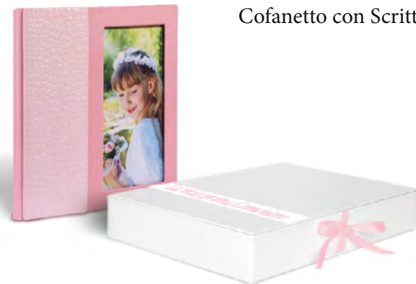
Cofanetto con Scritta

Cofanetto bianco con foto telata sulla parte frontale