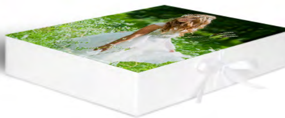
Cofanetto con Foto

Cofanetto bianco con nastrino di chiusura