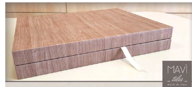
Cofanetto e Album linea Acero