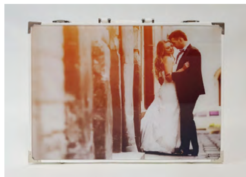
Facciata con plexiglass e foto

Consigliamo di abbinare alla valigia con foto dell'album principale, le pochette per i mini album dei genitori