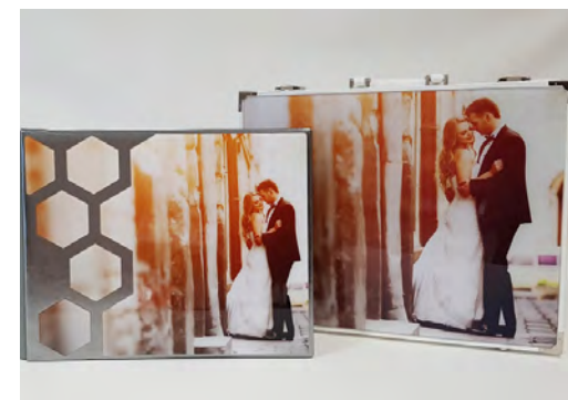
Album e Valigia