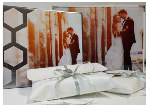
Album, Valigia e Mini Album con pochette per i genitori